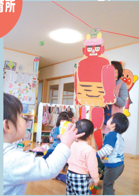
節分：鬼さんに豆代わりの風船をぶつけます。