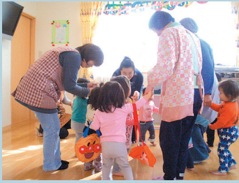
ひなまつり：みんなでお遊戯しました。