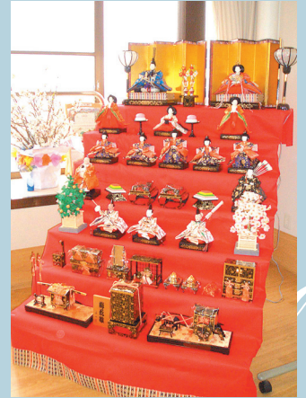
おいしい食事のあとは風船をつかったバレーボールをしました。