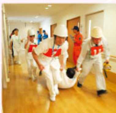
11月24日(水) 火災を想定した訓練に力が入ります。