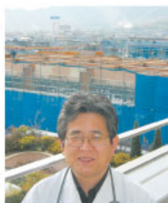
背景は屋上庭園、今年5月完成予定の工事中の新病棟、遠景には移動してくる第二病院が見える。