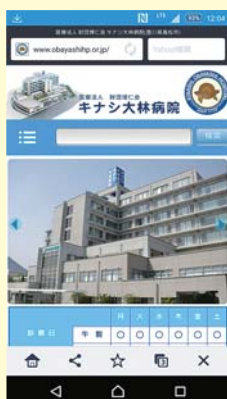
スマートフォン版

当院のホームページをアップしてから約10年が経ち、時代の流れと共にホームページを見る端末もパソコンからスマートフォン・タブレットに変わりつつあります。そこで、今回パソコン以外の端末からも見やすいホームページにリニューアルしました。