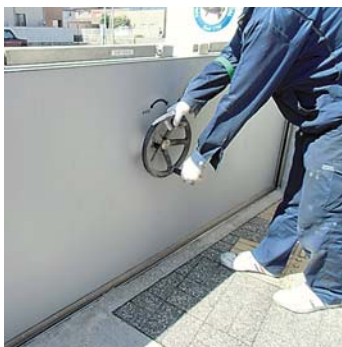
きちんと閉めるか点検しています。