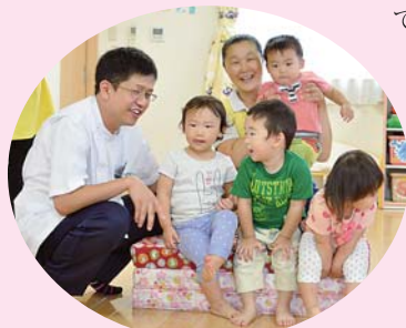
▲和泉作業療法士と保育所の子どもたち

そのような地域の皆さんの健康を守るために、当院ではこれまで訪問診療や訪問リハビリの取り組みを