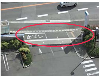
普段は防潮堤を開いています。

これからもきちんと点検し、患者さんに安心して療養していただける病院にしていきたいと思えます。