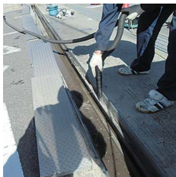
ゴミ等を取り除き、防潮堤がきちんと作用するようにしています。