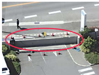
点検のために防潮堤を閉じた様子。