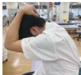
②頭から腰にかけてのストレッチ

スマホの見過ぎは姿勢や体調を崩しますので、間で体を伸ばすことを意識して下さいね!!