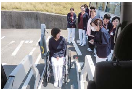
研修の中で行われた車椅子体験。患者さんの気持ちになって体験しました。