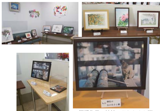
▲優秀作品：神社のおかあさん猫

令和元年、新時代の幕開けを飾る、素晴らしいアートを職員、家族の作品(絵・写真・刺繍など)から募集し、展示をして、来場者に投票をして頂きました。11月11日～30日まで院内展示を行い、入院患者さん、ご家族、職員からの投票をもとに、優秀作品が、『神社のおかあさん猫』に決まりました。「作品に癒されました」の声を頂くことができました。たくさんの投票ありがとうございました。