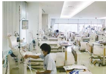
▲透析機械のチェック中

の体重管理やシャント血管への穿刺業務と透析中の患者さんの管理等を日々行っています。